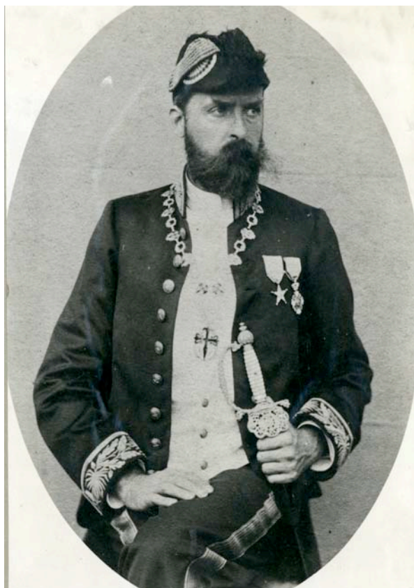
Photographie 2. Gouverneur général Félix Fuchs, s.l., s.d.